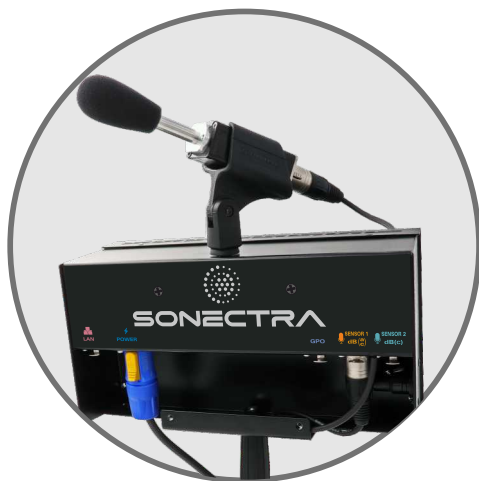
Face arrière de l'afficheur Live