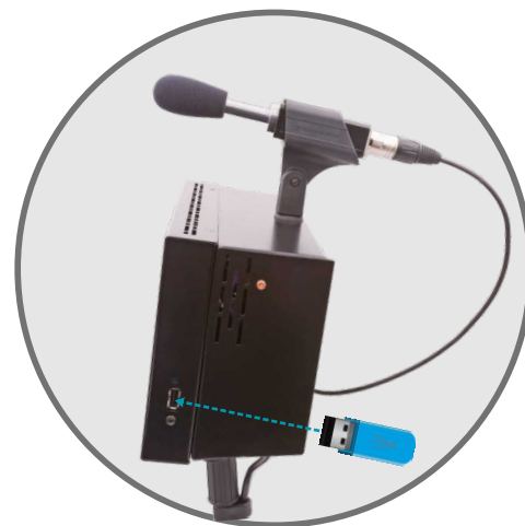
Embase USB permettant le téléchargement de l'historique et la mise à jour de l'afficheur