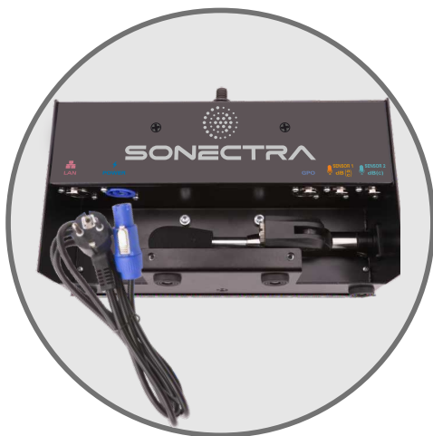
Câble secteur fourni avec l'équipement