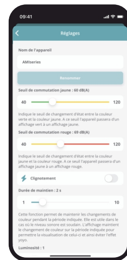
Réglages via smartphone

Historique : Permet le téléchargement de l'historique en LAeq 1 min sur les 480 dernières heures.