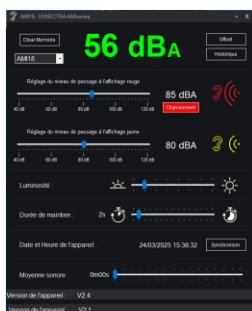
Interface logiciel PC